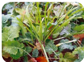
samosiewy zbóż przed zabiegiem