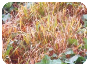
zasychające samosiewy zbóż